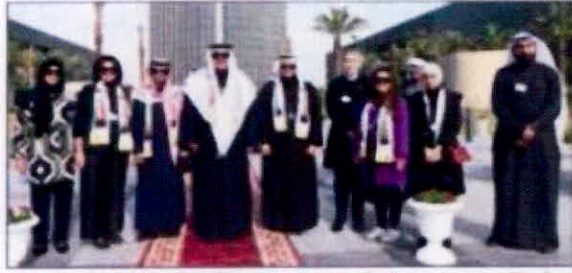
المصنف ومصرف المصرف مع فريق العلاقات العامة والإعلام

وبهذه المناسبة، تقدم المصنف بخالص التهاني والتبريكات إلى مقام صاحب السمو الأمير الشيخ صباح الأحمد وإلى سمو ولي العهد الشيخ نواف الأحمد وإلى الحكومة الرشيدة والشعب الكويتي الكريم، بمناسبة ذكرى الأعياد الوطنية والذكرى الثالثة لثولي صاحب السمو الأمير مقاليد الحكم، معرباً عن سعاداته واعتزازه بهذه المناسبة الوطنية، مضيفاً أنها مناسبة للتعبير عن مشاعر الحب والوفاء للكويت وتعزيز قيم الولاء والانتماء للوطن وترسيخ روح المواطنة في الأفراد. داعياً الله عز وجل أن يحفظ الكويت وأهليها وسعياً من كل مكروه، مقدماً الشكر لجميع من ساهم في إنجاح هذه الاحتفالية.